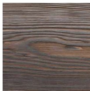
Świerk skandynawski Baltica 3