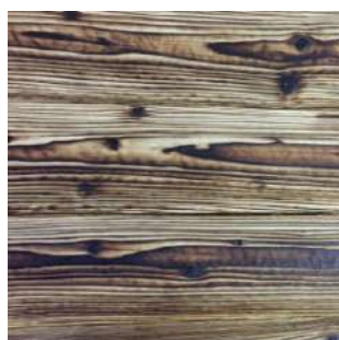
Świerk skandynawski Baltica 1