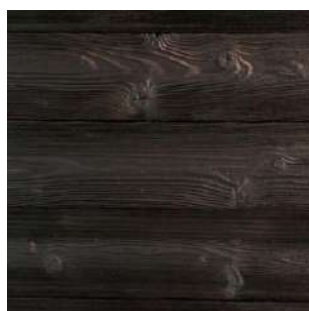
Świerk skandynawski Baltica 2