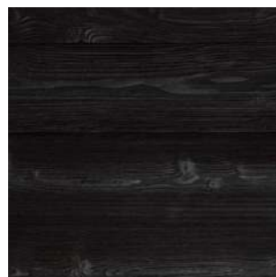
Świerk skandynawski Karpatia 2