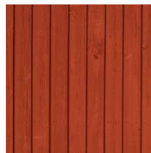
Świerk skandynawski Czerwień faluńska