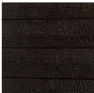
Świerk skandynawski Karpatia 1