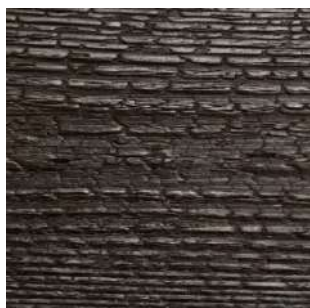
Świerk skandynawski Karpatia 3